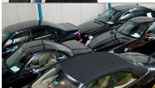
Luxusautos beim Auto-Pfandhaus.ch